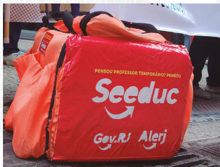
Ato na Alerj, contra o Projeto de Lei aprovado

Cláudio Castro, com apoio da ampla maioria da Alerj, aprovou às pressas um projeto que permite a contratação de cerca de 15 mil professores temporários , o equivalente a 30% do total de docentes da rede. Em vez de concurso (o último foi há 10 anos), o governo aposta em mais trabalho precário. O Sepe entrou na Justiça e, nesta campanha, luta pela revogação da Lei 10.363 , convocação dos aprovados e por novo concurso.